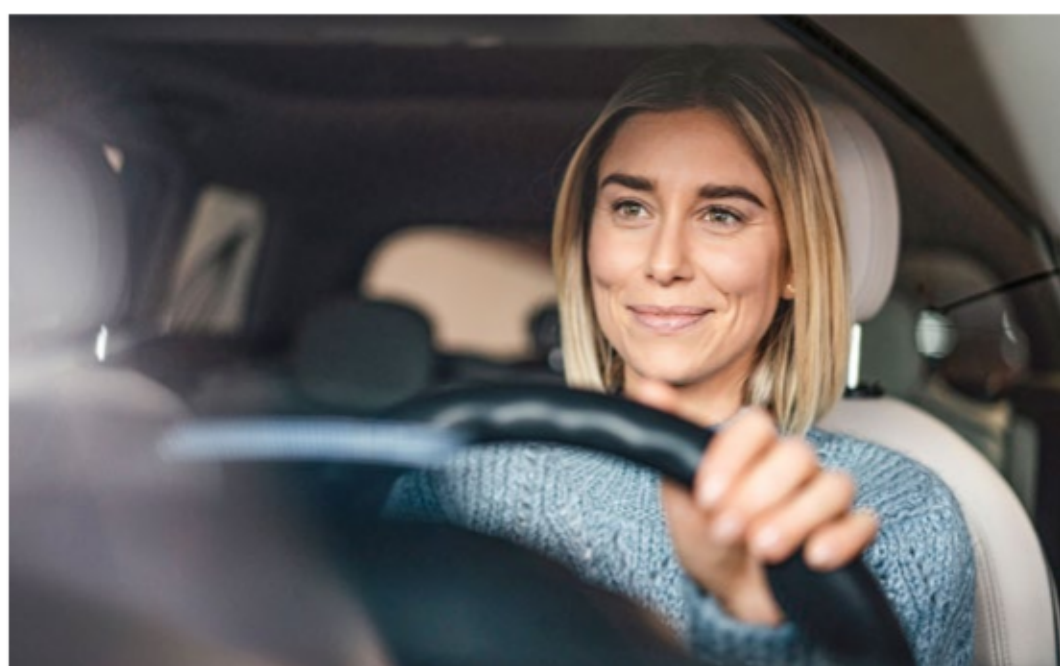
Prima Klima im Auto: Mindestens einmal jährlich sollte der Innenraumfilter gewechselt werden.

Innenraumfilter sollten einmal jährlich gewechselt werden