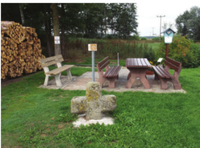
Das Wassertretbecken des Auracher Gemeindeteils Windshofen.