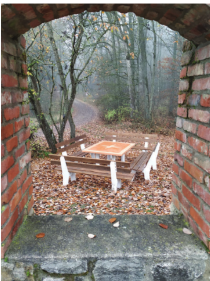
Ein Ort, um auf andere Gedanken zu kommen: Der Besinnungsweg.