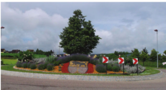
Der Auracher Kreisverkehr.

bestehenden Siedlungsgebieten auch nachverdichtet werden. Im Rahmen des Zweckverbandes „Altmühl-land A6“ ist die Gemeinde auch interkommunal unterwegs. Der Zweckverband hat bereits verschieden Projekte auf den Weg gebracht, unter anderem über das Regionalbudget die Sanierung unseres Besinnungsweges mit über 1.000 ehrenamtlichen Stunden, die Verschönerung des Wassertretbeckens in Windshofen mit über 150 ehrenamtlichen Stunden und die Errichtung eines öffentlichen Treffpunktes mit Feuerschale mit Sitzgelegenheiten am Pavillon in Aurach.