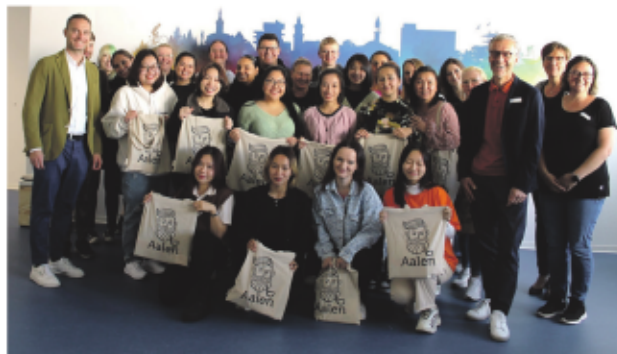
Oberbürgermeister Frederick Brütting begrüßte die neuen Azubis im Sozial- und Gesundheitswesen bei der DAA.

Berufsperspektiven sind hervorragend, da Fachkräfte im Bereich Gesundheit und Soziales händierend gesucht werden. Für junge Menschen mit Hauptschulabschluss eröffnen die Ausbildungen an der Berufsfachschule für Sozialpädagogische Assistenz bzw. Altenpflegehilfebene falls beste Berufsaussichten. Mit den Ausbildungsgängen im Sozial- und Gesundheitswesen leistet die gemeinnützige Bildungseinrichtung einen wichtigen Beitrag zur Sicherstellung des Fachkräftebedarfs. Ein kurzfristiger Einstieg ins laufende Ausbildungsjahr ist bis Ende Oktober, Bewerbungen für das Schuljahr 2024/25 ab sofort möglich.